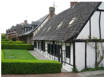
Maisons flamandes à Terdeghem