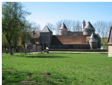
Le château d'Olhain (15° s)