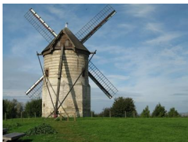
Le moulin de Watten

En outre, la ville de Lille, se trouvant sur le parcours mais, à peine traversée, mérite qu'une visite lui soit réservée.