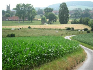
Loker et le Mont Kemmel