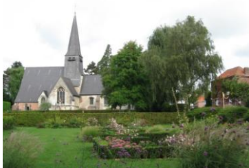
L'église d'Englos (12°, 16° s)

Pour chaque contrôle, est accepté le timbre humide d'un commerçant ou d'une collectivité mentionnant le nom de la localité ; il est possible de coller une photo de la bicyclette avec le panneau de la localité ou un élément identifiable (le seul vélo du participant). A défaut, il devra obtenir un tampon de la localité la plus voisine et indiquer les raisons de l'absence du cachet adéquat.