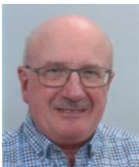
J-Michel CATOIRE Communication