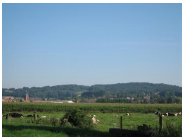
St-Jans-Cappel et le Mont Noir