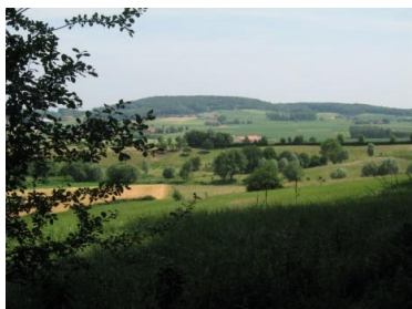
Le Mont Kemmel ( Kemmelberg )