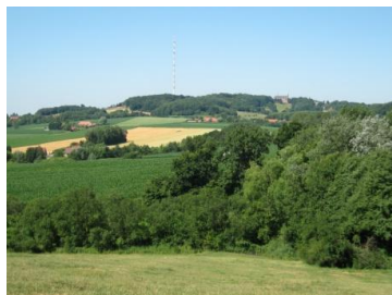
Le mont des Cats