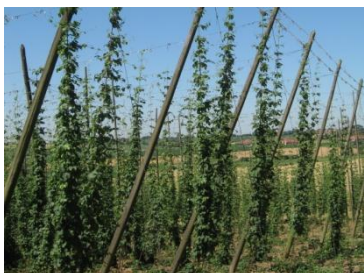
Houblonnière près du Mont Kokereel

Le patrimoine est riche : des villages pittoresques, des églises intéressantes, de nombreuses chapelles et sept beaux moulins à vents.